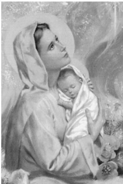
MARIJA: Verament u naturalment Omm Alla!