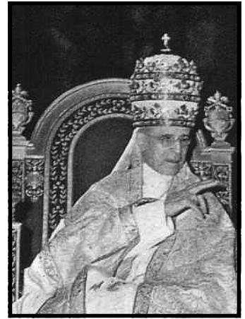
IL-PAPA PIJU XII (1939-1958): IL-PAPA IA' "L-ASSUNTA"!