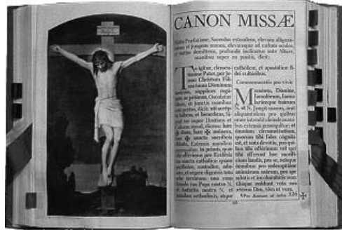
"L-AKBAR TALBA tan-Nisrani hi I-QUDDIESA...."

Kultant tiltaqa' ma' xi hadd li jgħidlek li ma jkunx jaf eżatt x'qiegħed jiġri, x'attivitajiet ikunu ser jew qegħdin isiru, jew x'għaqdjet hawn jahdmu fi hdan il-parroċċa. Il-parroċċa, bl-għajjnuna tal-Kummissjoni "Relazzjonijiet Pubbliċi u Media", dawn l-aħħar snin hadmet bis-siħh sabiex l-informazzjoni tkun aċċessibbli għal kulhadd. Minbarra t-titjib fil-prezentazzjoni tan-notice boards u fil-website tal-parroċċa, din is-sena hu mistenni li jkollna f'idejna ktejjeb ta' informazzjoni fuq il-ħajja pastorali fil-parroċċa. Dan il-ktejjeb hu mistenni li jitqassam lil kull familja, sabiex iservi ta' riferenza kull meta jinqala' l-bżonn.