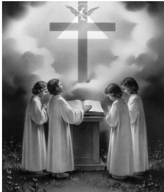
HIDMA b'riżq LABBATINI u t-TFAL ta' WARA L-GRIZMA.

Din hi t-tema ċentrali li tiġbor fiha l-ħidma pastorali ta' dawn is-sentejn. Infetaħ iċ-Ċentru għall-Persuni b'Diżabbiltà u qegħdin isiru diversi attivitajiet fih. Hemm il-ħsieb li kontinwament nistudjaw il-possibiltajiet ta' kif jitjiebu s-servizzi offruti f'dan iċ-Ċentru. Il-ħsieb hu wkoll li jsiru attivitajiet speċjal għal gruppi partikolari ta' nies, fosthom, ir-romol, il-familji u ż-żgħażaġh. Sabiex dan iseħħ, il-parroċċa għandha numru ta' kummissjonijiet biex jgħinu lill-Arċipriet fil-ħidma pastorali.