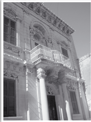
Il-faccata tad-Dar tal-Qasam tal-MUSEUM tas-Subien, fi Triq De Rohan, Haż-Żebbuġ