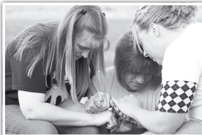
Bil-parteeċipazzjoni shiha ta' KULHADD insaħħu u nissuktaw nibnu aktar fuq dak li bnejna matul dawn l-aħħar snin.

Fil-ġranet li għaddew, stedinna lil kull min b'xi mod jixtieq jagħti kontribut dirett fil-hidma tal-parroċċa. Għaldaqstant qieghed inhegġeġ lil dawk kollha li jixtiequ jagħtu s-sehem tagħhom biex ma joqogħdux lura. Qieghed nagħmel dan, għax nemmen bis-shih fil-parteeċipazzjoni tal-lajċi fil-parroċċa tagħna; u li din il-parteeċipazzjoni ma għandhiex tkun BISS u esklussivament