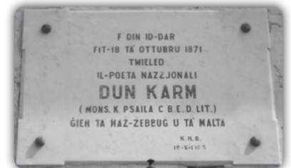
L-irhama mwahħla mal-faċċata tad-dar, fi Triq l-Isqof Haż-Żebbuġ, fejn twield Dun Karm.

Fl-istess waqt ma tonqosx it-tbeżbiża: “Għaliex meta niġi nżurek, Ma narax indafa u sliem?”