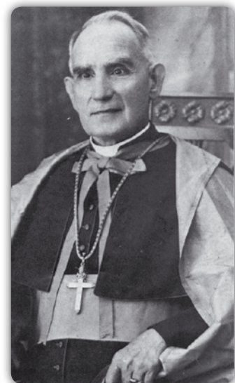
Il-Poeta Nazzjonali Malti Dun Karm Psaila (18.10.1871 – 13.10.1961).