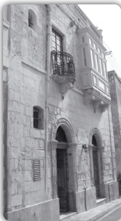
Il-faċċata tad-dar, fi Triq l-Isqof, fejn twieled il-Poeta Nazżjonali Malti.

(miktub fit-30 t'April 1943) u dak fl-Innu Malti (miktub f'Ġunju 1925): tal-ewwel, fuq bażi parrokkjali (sejha għal għaqda bejn l-aħwa Żebbuġin) u, tat-tieni, fuq bażi nazzjonali (sejha għal għaqda nazzjonali). Fil-fatt, l-aħħar vers tal-Innu Malti, jgħid hekk: "Seddaq il-għaqda fil-Maltin u s-sliem"; filwaqt li, f'dak lil San Filippu t'Aggira: "Zomm il-għaqda, zomm l-imhabba – Ġewwa qlub iż-Żebbuġin."