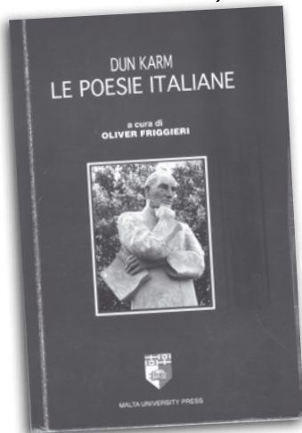
Il-poeziji bit-Taljan ta' Dun Karm, miġburin mill-Prof. O. Friggieri.