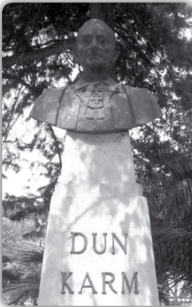
Il-monument f'għieħ Dun Karm Psaila, fi Triq Sciortino, Haż-Żebbuġ.

Lil Dun Karm mhux taqrah trid iżda tistudjah. Kull poezija tiegħu fiha messaġġ, hija talba, hija xenqa, hija karba, hija patrijottika, hija dedika; iżda fuq kollox hija hsieb profund ta' dak li qagħad jirrifletti l-poeta qabel hażżeż il-versi tal-poezija.... l-istess poezija li twieldet miegħu.... talent naturali li ma ħbiehx jew berbqu, iżda użah u katru u għadu jirrendi l-imghax sal-lum.